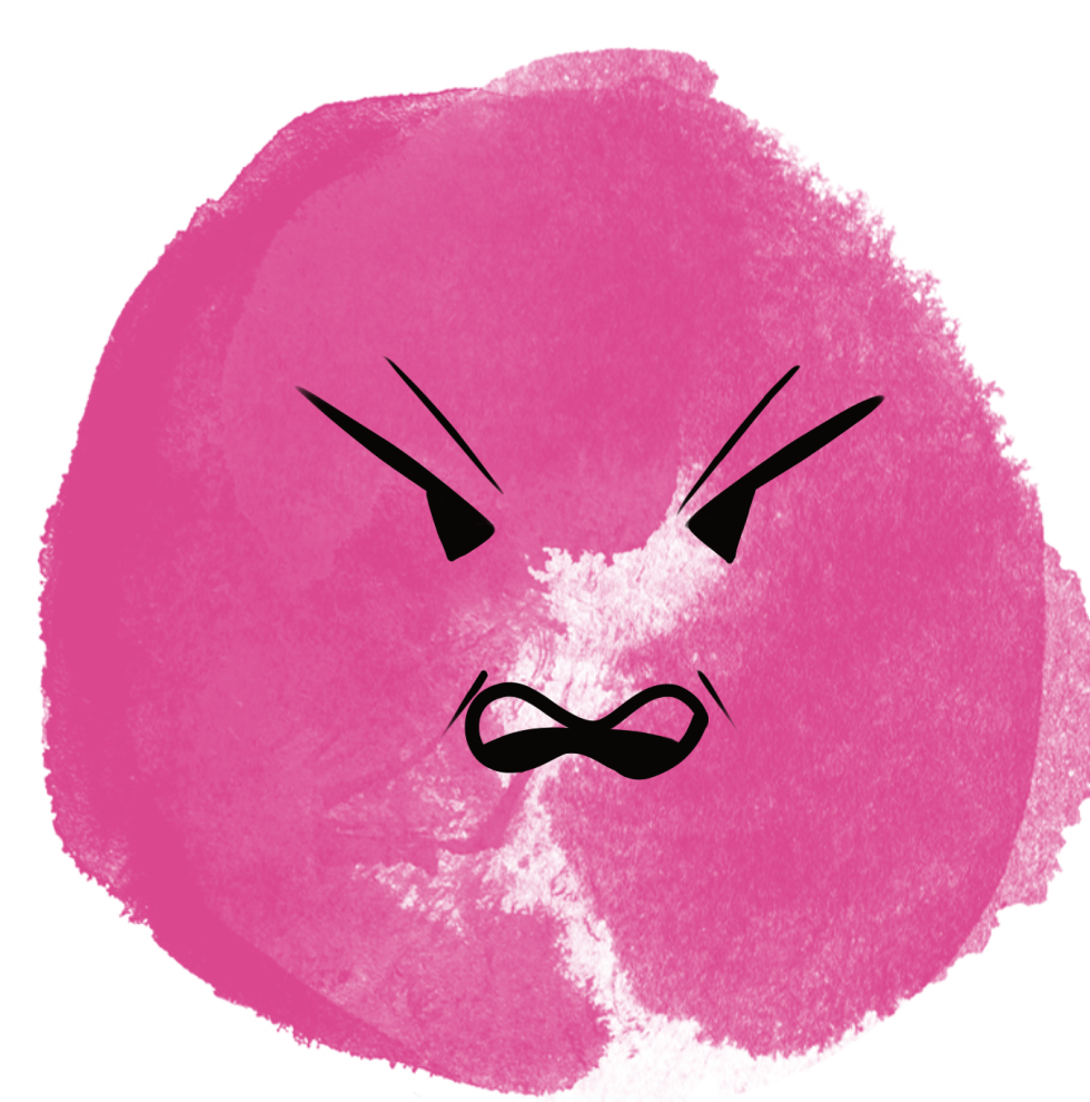
Vztek se postaví problémům čelem