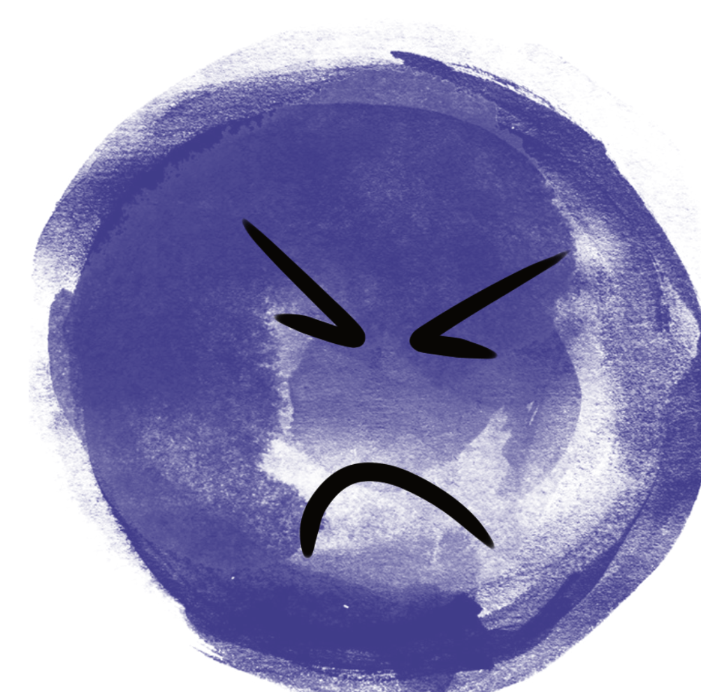
Odpor rozlišuje dobré od špatného