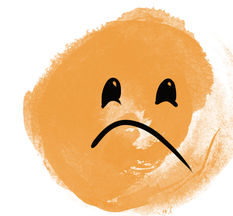
Nespokojenost vede ke změně