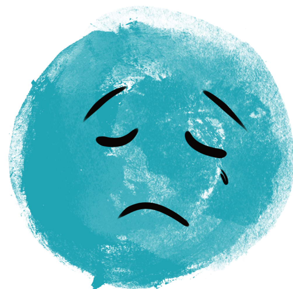
Smutek nám říká, na čem záleží

Ale všechny pocity jsou důležité. Nezapomeň, že